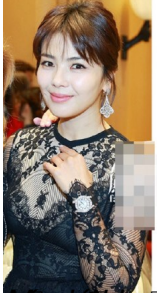
Địch ng Yên cũng sở hữu một chiếc đồng hồ tinh giản nhưng mang đậm phong cách Omega Aqua Terra 150