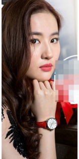
Địch ng Yên cũng sở hữu một chiếc đồng hồ tinh giản nhưng mang đậm phong cách Chanel Boyfriend có giá khoảng hơn 300 triệu đồng.